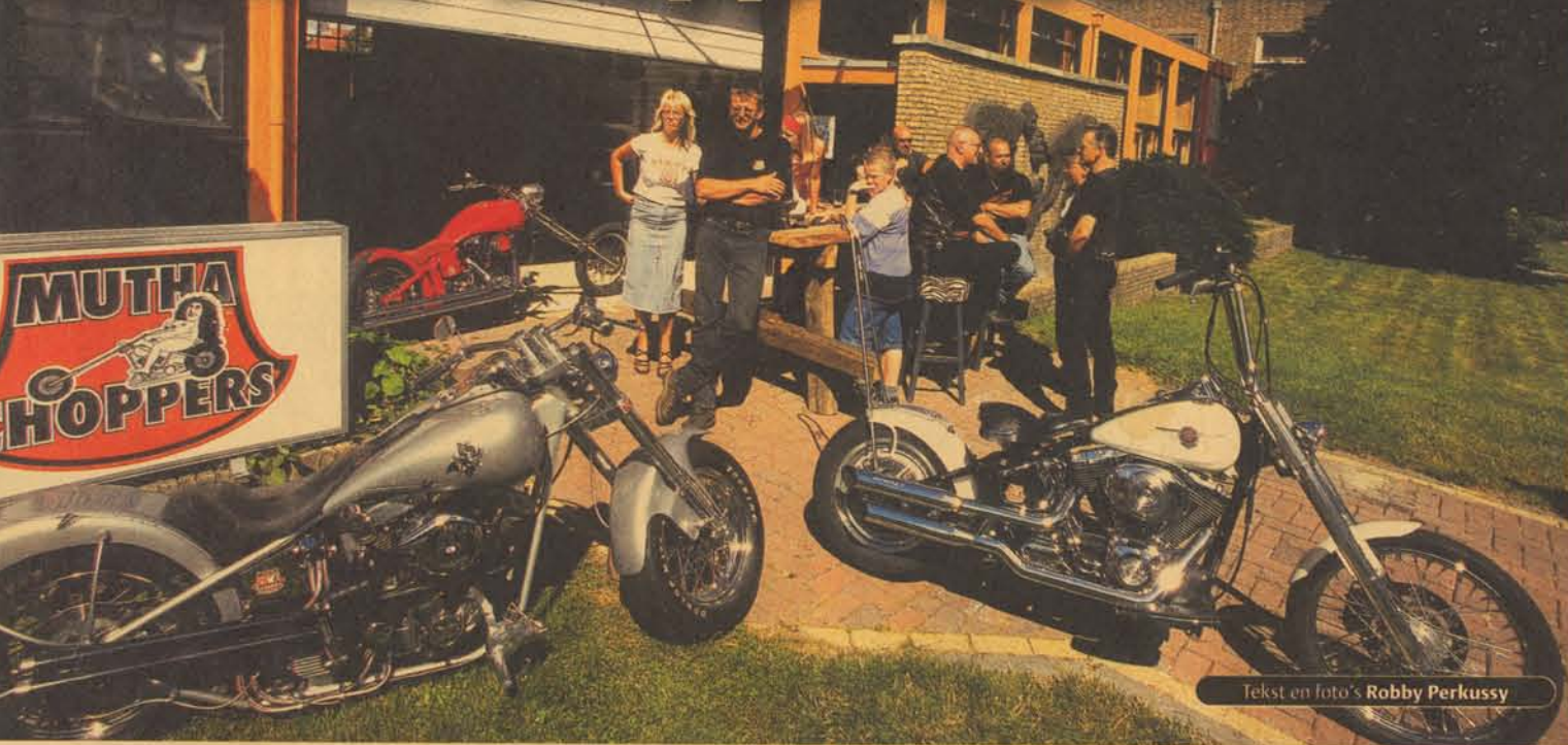
Tekst en foto's Robby Perkussy